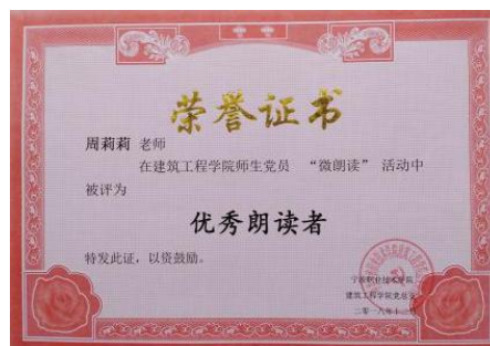
图 1 党总支活动

课后热心参加党内活动，在张人亚党章学堂开展现场党课，在校“首届微型党课比赛”中获二等奖。在分院党总支的“五微共建” - “微朗读”