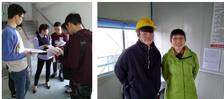
图 7 课外带学生实地辅导

教学” “薪火谈心” 四把火。坚守教学阵地，坚持为党育人、为国育才，始终秉持一个信念：“教师自身就是一堂好的思政课。” 一直致力于提高自身的专业技能和理论修养，助力学生成长，课上突出能力、情感、创新、实践导向，让学生们领略信仰之美、奋斗之美、奉献之美，感受到与祖国的同频共振，立志把小我融入大我。