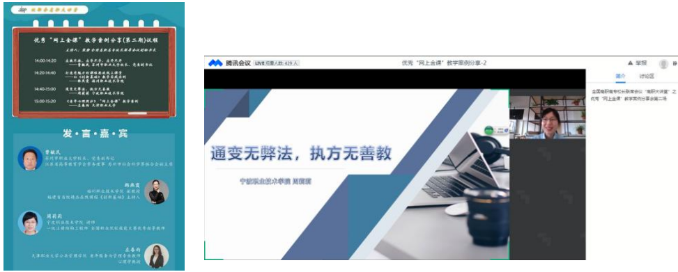
图 9 优秀“网上金课”教学案例