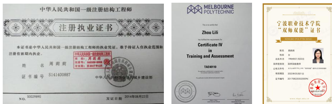
图 2 执业资格证书

②积极参加教师培训。课余参加建筑专业技能类培训，不断提升专业技能，获专业技能类（如：一级注册结构工程师）和教学类（如：国际职教能力测评 Certificate IV）证书。