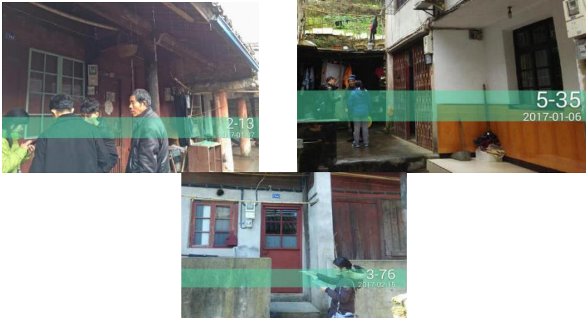
图 4 带学生开展“农房安全调查”社会实践

①带 5 名学生参与浙江核力建筑特种技术有限公司的农房安全调查，2019 年完成校级重点课题“宁波地区农房抗震能力现状调查与对策研究”。