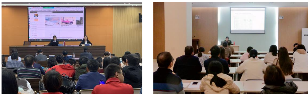
图 5 赴兄弟院校开讲座交流

③赴丽水职业技术学院、湖州职业技术学院等校,开展教学类示范讲座,积极扩大学校影响力。