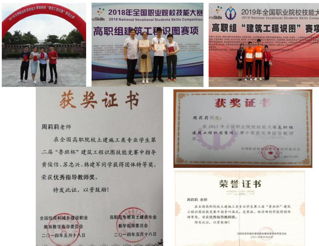
图 6 技能竞赛全国优秀指导教师

③指导尖子学生成就梦想。指导学生获校结构设计竞赛二等奖；第二届、第三届全国高职院校“鲁班杯”建筑工程识图技能竞赛团体和个人最高奖，该同志获优秀指导教师奖；16-19 年连续四年获浙江省识图比赛团体及个人一等奖；17-19 年获识图国赛团体一等奖 1 次、二等奖 2 次，该同志 3 次获国家级优秀指导教师奖。